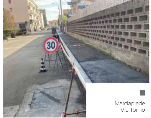
■ Marciapiede Via Torino