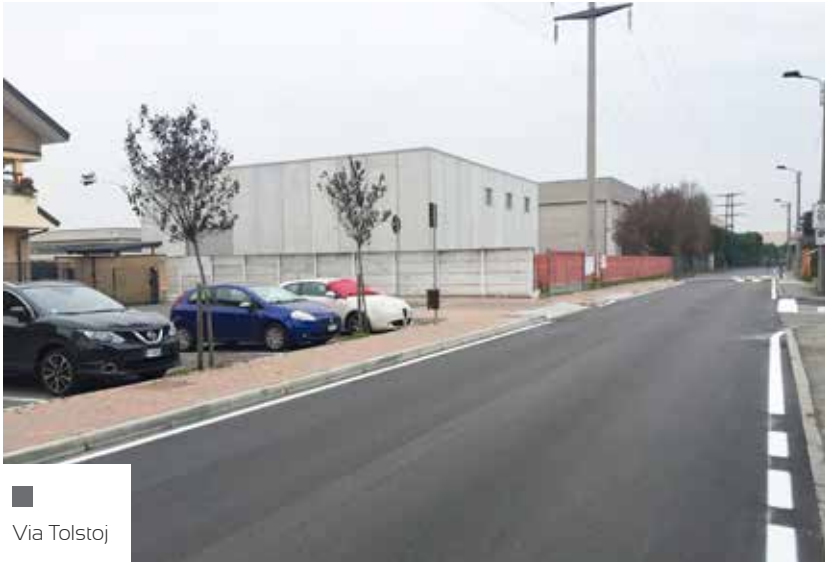
■ Via Tolstoj

In primavera, oltre alla conclusione dell'intervento a San Francesco, i cantieri riguarderanno altre arterie principali (come via Trieste) per un complessivo di oltre 30.000 metri quadri di nuovi asfalti.