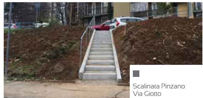
Scalinata Pinzano Via Giotto