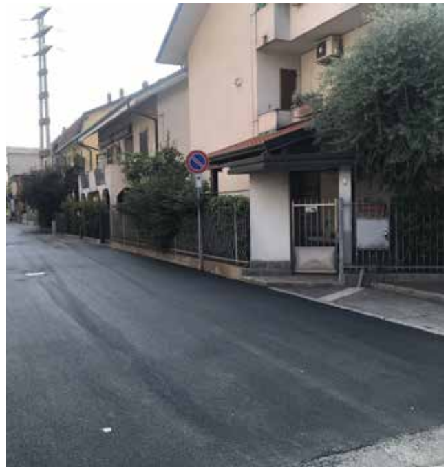
■ I lavori in Via Pascoli