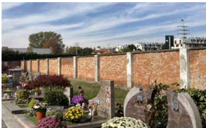
■ Cimitero di Pinzano

A breve, verranno portate a termine nei cimiteri anche le sistemazioni degli intonaci e delle coperture del colombari, nonché le murature della recinzione.