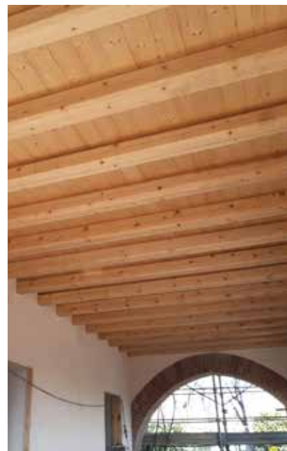
■ Cascina Dandolo durante i lavori interni

Fondamentale per l'Amministrazione limbiatese è riuscire a dare una risposta al bisogno abitativo di famiglie che sono in lista d'attesa.