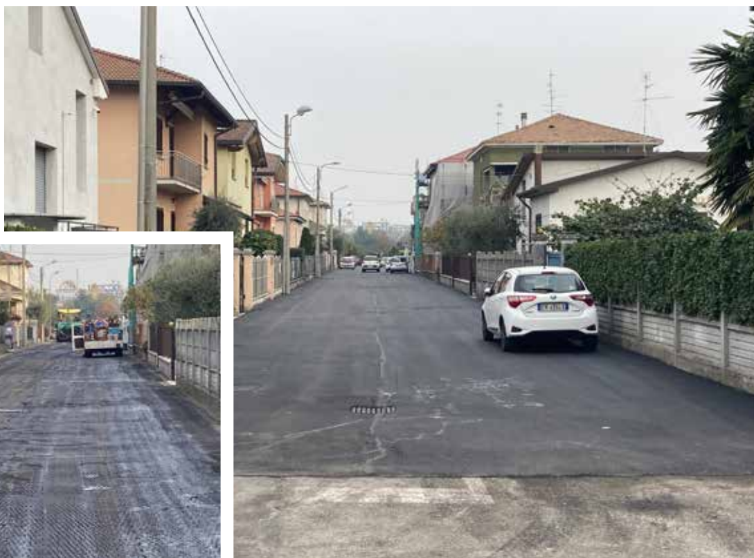
■ I lavori in corso in Via Aosta

In molte vie sono stati sistemati anche i marciapiedi , alcuni dei quali verranno ultimati a breve.