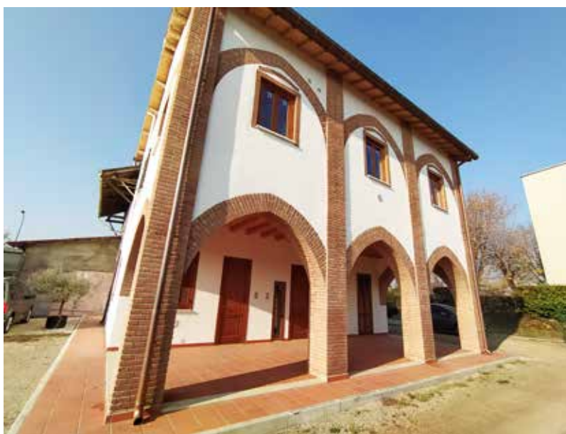
■ Cascina Dandolo dopo i lavori