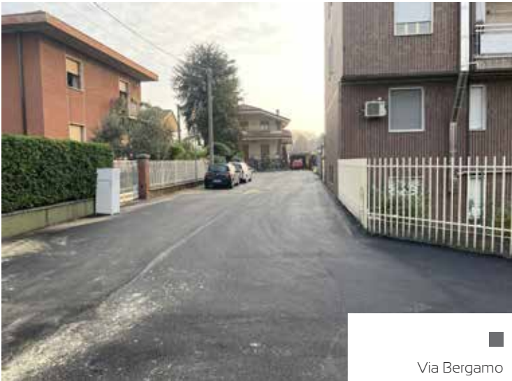
■ Via Bergamo