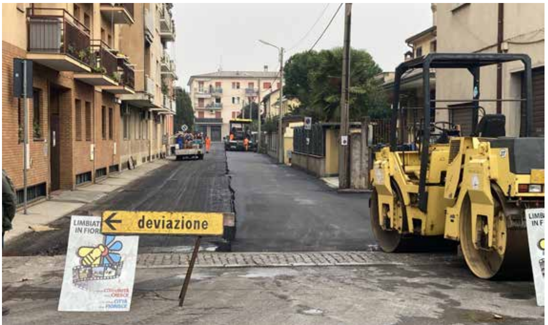
■ I lavori in Via Padova