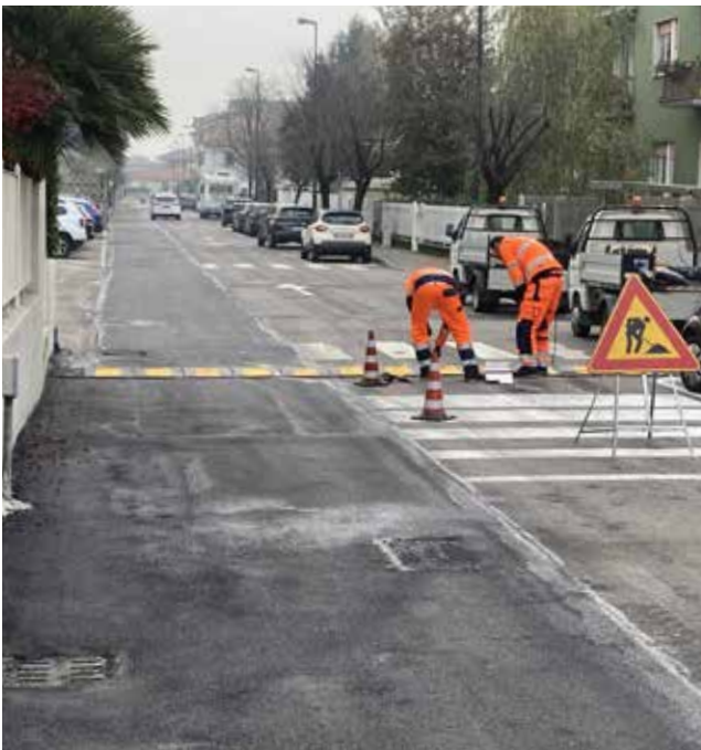
■ Via Monte Generoso