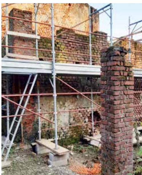
■ Cascina Dandolo prima dei lavori

Ecco i nuovi alloggi in edilizia residenziale pubblica