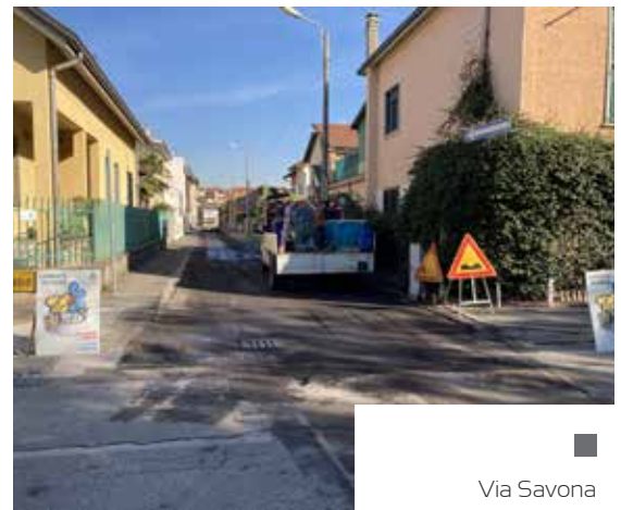
■ Via Savona