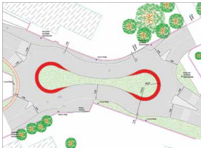
La rotonda in corso Como

Con gli accordi di competitività, verrà ampliato il parcheggio di via Manara, verrà realizzata una pista ciclabile lungo via Garibaldi (che collegherà la ciclabile già esistente all'Istituto Agrario) e verranno realizzate una rotonda tra via Manara e via Isonzo ed una seconda tra corso Como, via Manara e via Caserta. Una volta ultimati i lavori, l'Amministrazione valuterà possibili variazioni viabilistiche, al fine di rendere più fluido il traffico, favorendo così gli insediamenti produttivi e gli abitanti del quartiere.