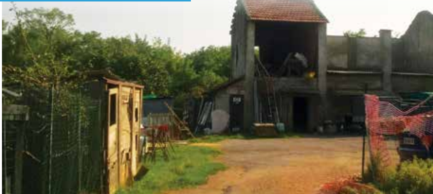
La Cascina Dandolo

Al termine della fase progettuale, il Comune di Limbiate ha indetto la gara pubblica per affidare l'esecuzione dei lavori, che sono iniziati a metà settembre . Come da contratto, entro la primavera 2019, Cascina Dandolo sarà sistemata e potrà contare su tre appartamenti da destinare al patrimonio di Edilizia Residenziale Pubblica del Comune