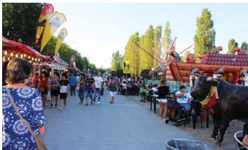
Grande successo per la Fattoria in Piazza con Te, promossa da Amiamo Limbiate in collaborazione con tante associazioni limbiatesi

scambio epistolare conservato presso la Sinatra Foundation di New York, è stato ricostruito l'amore turbolento tra Frank Sinatra e Ava Gardner.