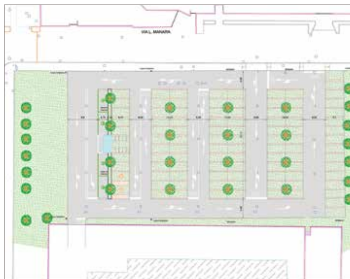
I parcheggi in via Garibaldi