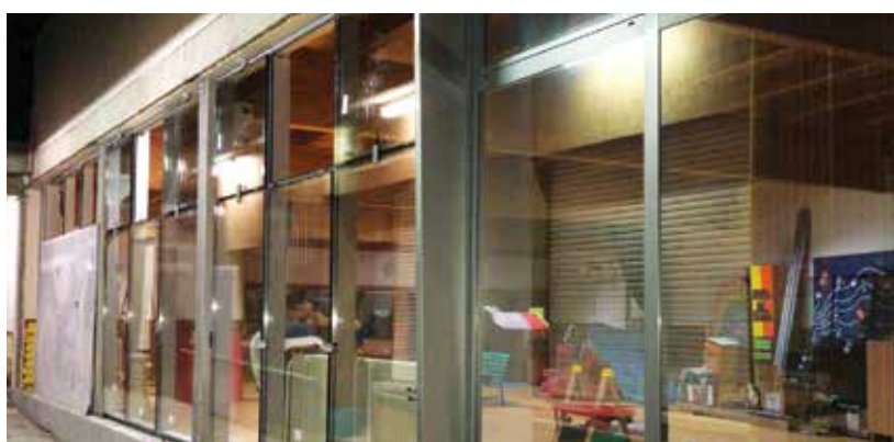
Installata ad ottobre alla scuola materna di via Pace